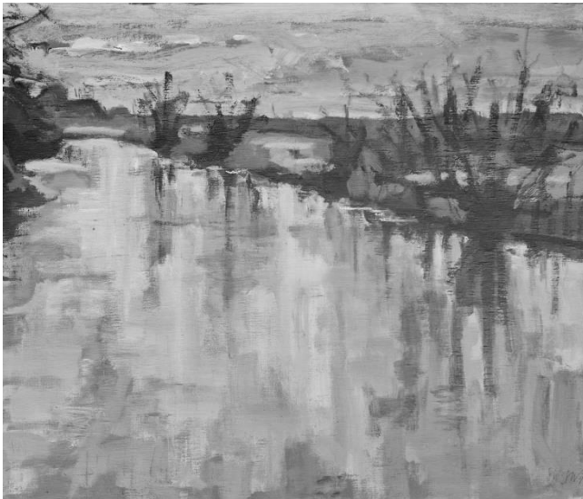
tussen de verlaten 2018, olieverf 55x65 cm